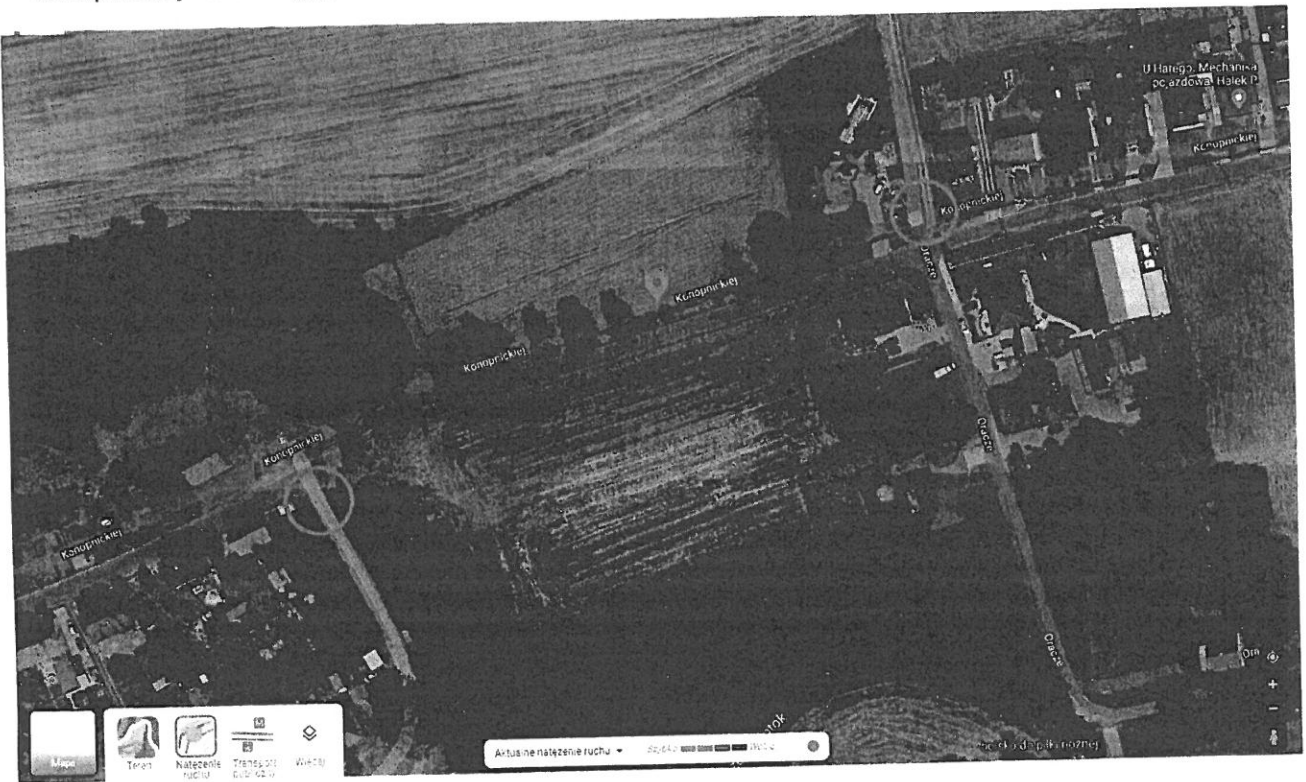
— konopnickiej - poczatek.jpg